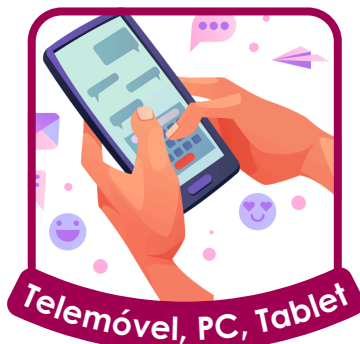
Telemóvel, PC, Tablet