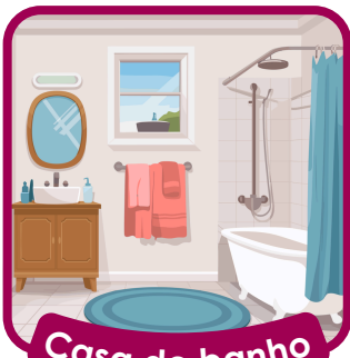
Casa de banho